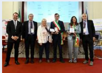
Bellegra e Farnese