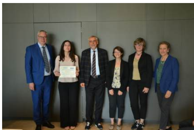
Primo classificato Liceo Scientifico G. Marinelli di Udine

D'altronde, come lo stesso Bando ha ribadito, «garantire e realizzare la solidarietà non è compito solo dell'Unione Europea, costituisce un preciso dovere delle persone, al quale le stesse non possono sottrarsi».