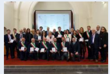
Delegazione - Lombardia