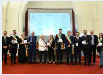
Castiglione Messer Marino, Fara San Martino, Fossacesia, Guardiagrele, San Salvo e Tortoreto