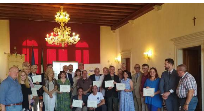
Premiazione Bando Gemellaggi edizione 2024