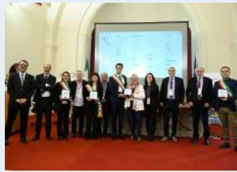
Carpi, Montechiarugolo, Piacenza e Scandiano