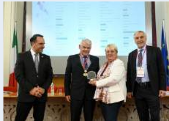
Cortina Sulla Strada Del Vino