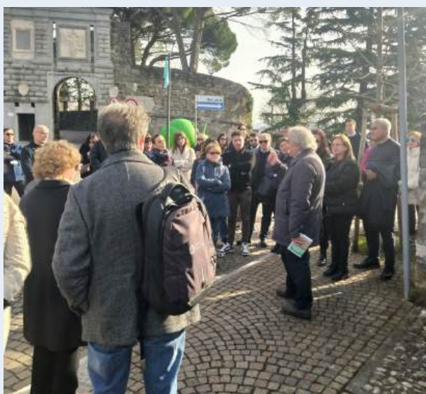
Borgo Castello - Gorizia

Le delegazioni dei Comuni hanno partecipato nel weekend a visite culturali nei vari siti del territorio , riscoprendo il valore condiviso di un'identità costruita sull'incontro.