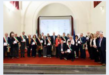
Buttrio, Chiopris-Viscone, Cividale Del Friuli, Mortegliano, Prepotto, Romans D'Isonzo, Ronchi Dei Legionari, Ruda, Spilimbergo e Staranzano