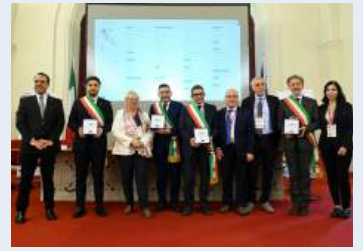
Bellizzi, Greci, Montaguto e Ottati