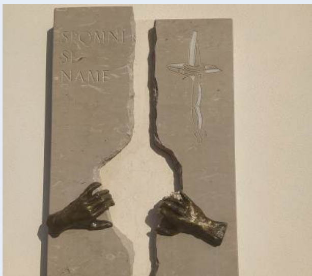
Cimitero di Merna