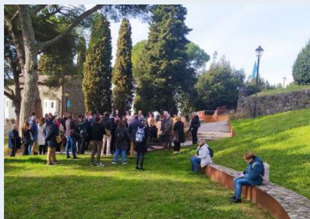
Borgo Castello - Gorizia

Il programma ha offerto un ricco itinerario alla scoperta del territorio transfrontaliero e del suo straordinario patrimonio culturale. Le delegazioni hanno visitato il suggestivo cimitero di Miren/Merna, simbolo di memoria condivisa tra Italia e Slovenia - dove è ancora visibile la linea che divideva le tombe tra i due Paesi, per poi proseguire verso il pittoresco borgo di San Daniele del Carso/Štanjel, dove le opere dell'architetto Max Fabiani raccontano una visione architettonica unica e profondamente legata al paesaggio. La giornata è proseguita con un'esperienza enogastronomica nella cantina Vie di Romans a Mariano del Friuli, tra botti, calici e sapori del territorio. Il giorno seguente, la visita guidata ad Aquileia ha permesso di esplorare uno dei siti archeologici più importanti d'Italia, patrimonio UNESCO. ■