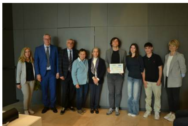
Secondo classificato Liceo C. Percoto di Udine e Premio Speciale "Enzo Barazza"