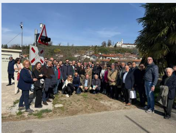
Valico del Rafut