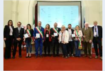
Calcinaia, Capannoli, Castelfranco Piandiscò, Lajatico e Prato